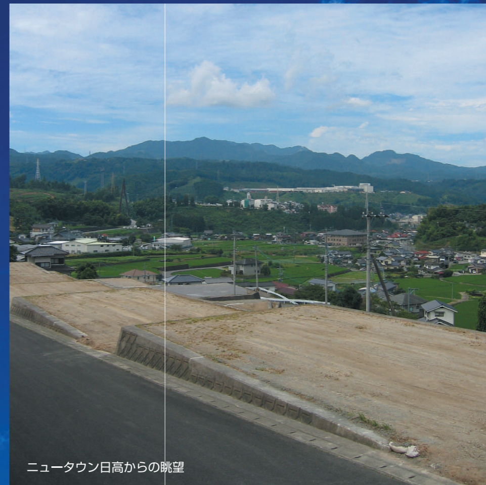
ニュータウン日高からの眺望